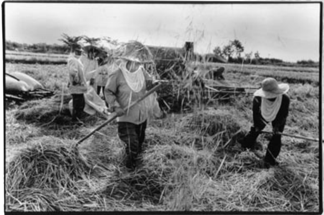
Op de Filippijnen was de 'groene revolutie' een aanslag op de diversiteit van de voedselgewassen.